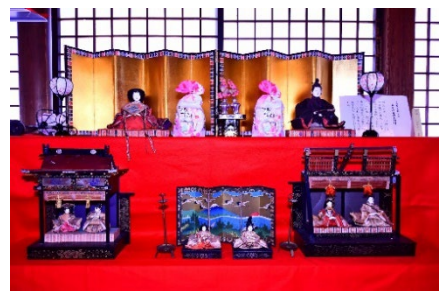
水野安弘(嘉永4年のお雛様)