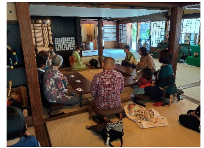
端午の節句呈茶会

4 月 29 日(水)にはいろいろの暖かな炎を楽しみながらのお話会。5 月 3 日(日)～5 月 6 日(水)には恒例となった子どもたちも参加しての鯉のぼり揚げ。5 月 5 日(火)には呈茶会が催され、孫のようなお子さんが点てたお茶をいただく姿が“ほんわかした呈茶会”でした。