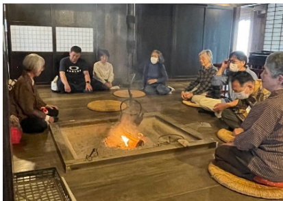
いろり端お話の会